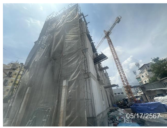
รูปที่ 1-1 สภาพภายในพื้นที่โครงการ